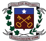
Collège Mathieu (Saskatchewan)