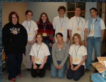
À droite : les élèves du groupe Médias 11411 H03.